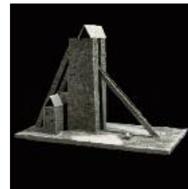
Les renonçants Faïence noire - H : 27 x 30 x 22 cm 1987.