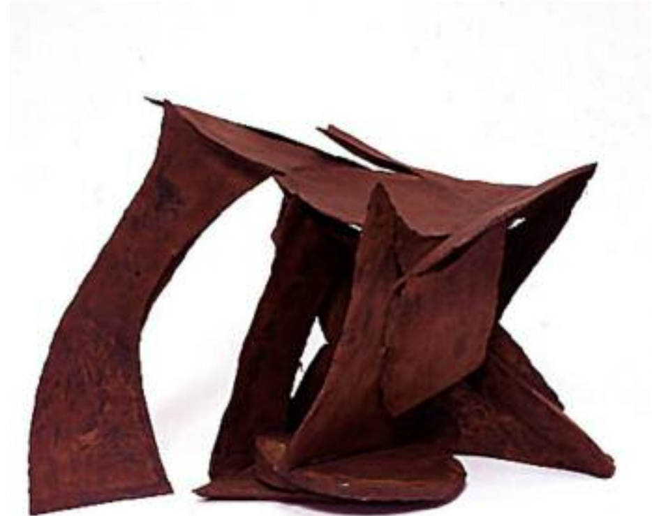
L'arche Fer - 68 x 50 x 50 cm - 2002

"Sculptures ? Comparés à l'aspect massif, compact, de la ronde bosse traditionnelle, il semble que le mot constructions définit mieux le caractère spécifique des travaux d'Annie Lacour. Ce terme polyvalent convient à la fois à l'oeuvre définitive obtenue par l'artiste comme à sa technique, aux matériaux employés comme à l'élaboration de son projet.