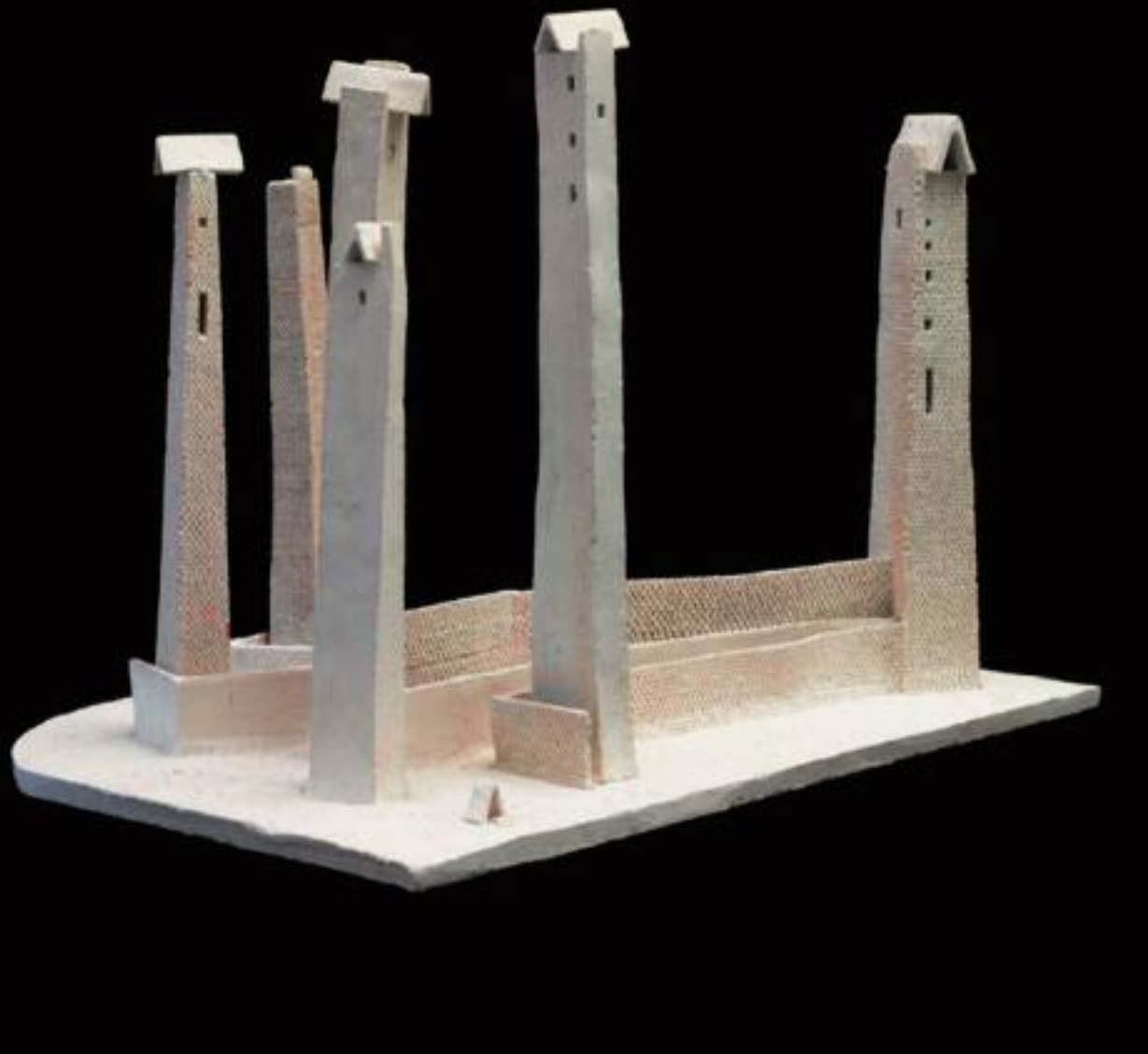
Paysage aux cinq tours faïence blanche - H : 35 x 47 x 37 cm - 1994