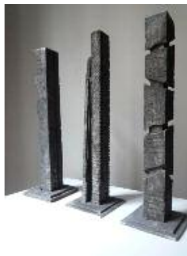
Sans titres - Fonte d'aluminium