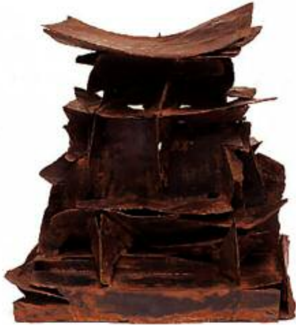
Tramette I Fer - 45 x 41 X 27 cm - 2000