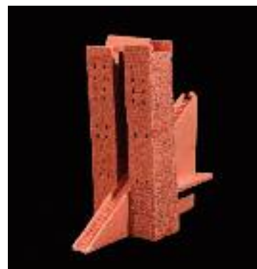
Passerelle rouge Faïence rouge - H : 27 x 20 x 26 cm 2006

Aujourd'hui la terre s'impose à moi comme une évidence, une nécessité qui m'accompagne et me nourrit. Un mot, une image me permettent de rebondir et d'inventer un lieu, de créer un univers onirique singulier nourri de Borges, Calvino ou Dante. Mes oeuvres tapissent mes murs, habitent mes étagères, telle une chorégraphie du silence et j'aspire à les voir envahir d'autres lieux, être confrontés à d'autres regards. »